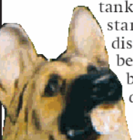
Konstgjord hund vid grav.

TEXT: INGRID ARINELL