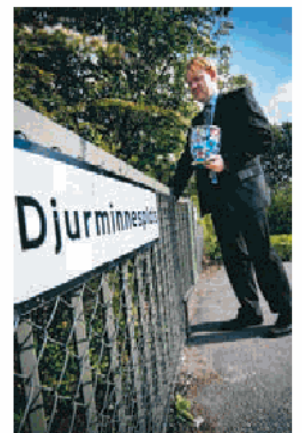
På väg till en ceremoni.