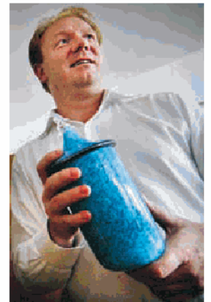
Här med specialbeställd urna som matchar Cadillacen.